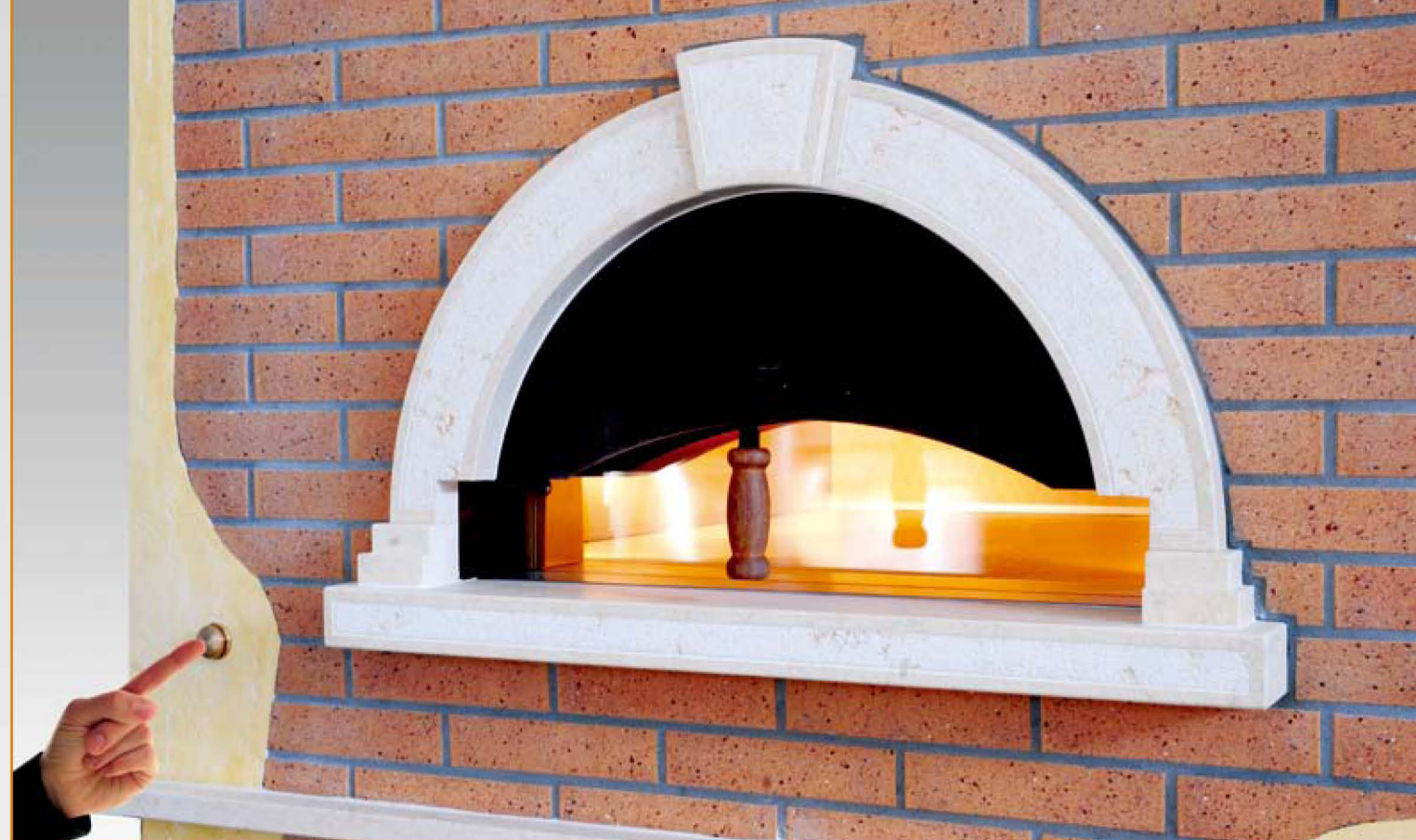
Pulsante elettrico di chiusura e apertura del forno

Quadro comandi elettronico con timer che consente di programmare l'accensione del forno in orario a scelta dell'utilizzatore (due orari memorizzabili). Mantenimento e controllo automatico delle seguenti temperature: cielo, platea e bilanciamento lato sinistro e lato destro della platea. Regolazione automatica del forno al 50% o 100% della potenza.